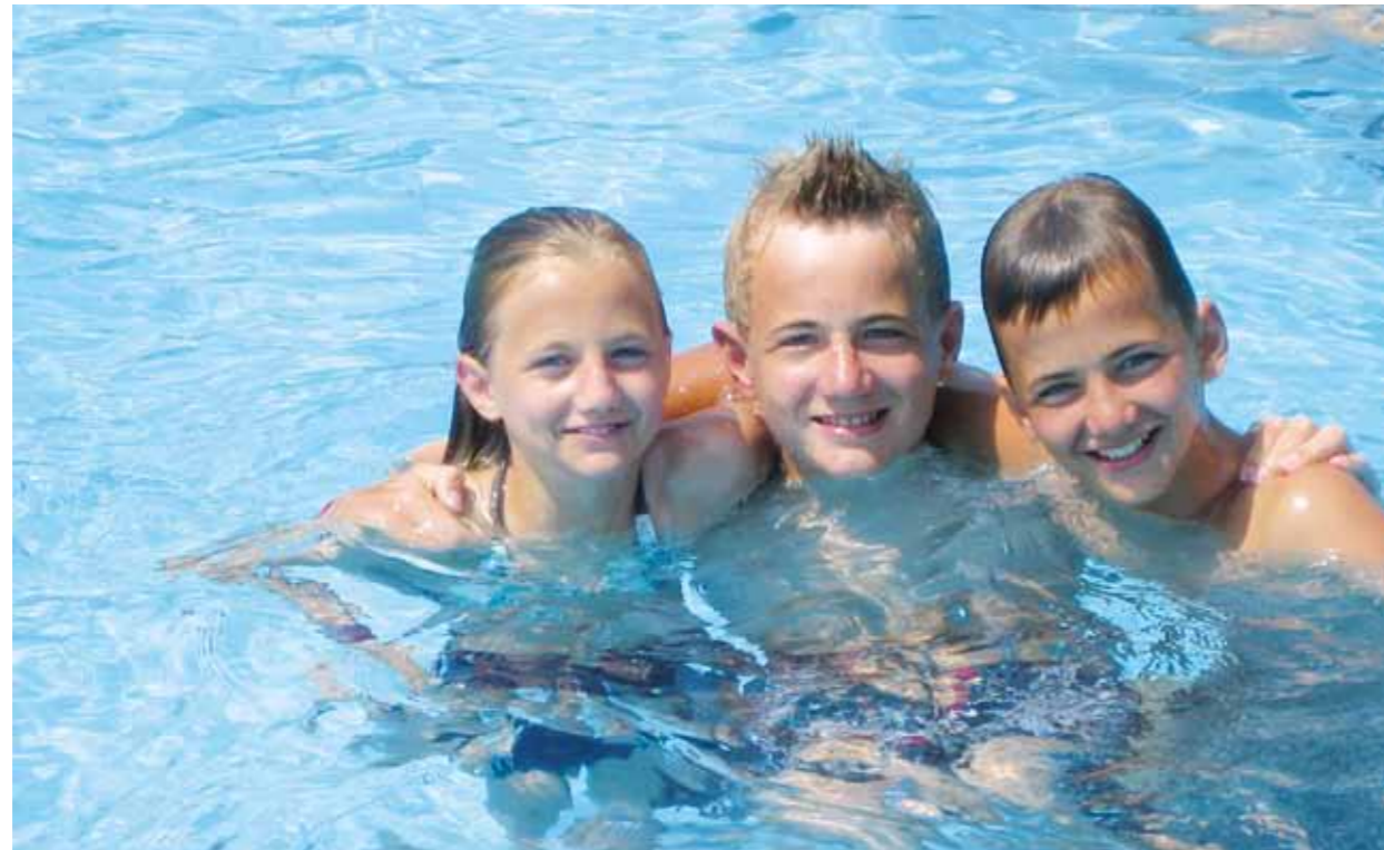
Le soleil brille chez les ados....

La relève de la SSS a une année riche en événements derrière elle. Chez les dames, l'équipe nationale junior a réussi à obtenir la médaille de bronze dans la discipline line throw. Les hommes ont dû se contenter de la 4e place.