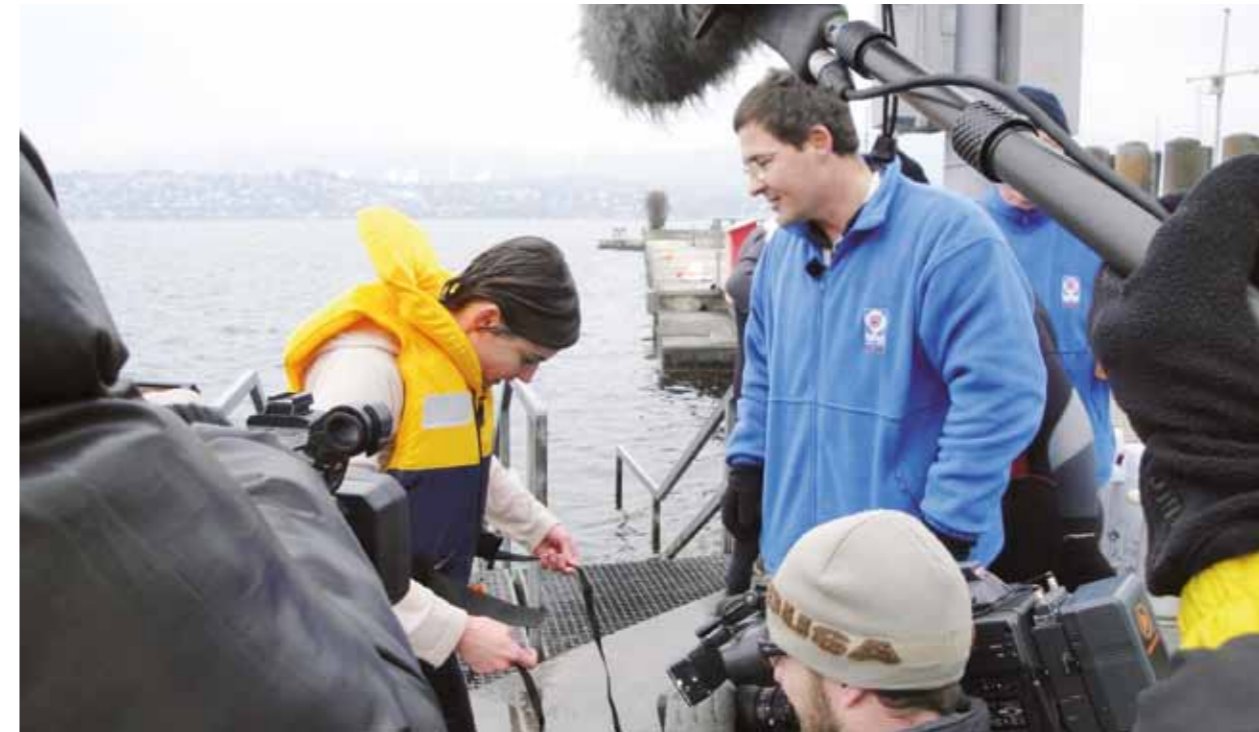
La télévision a participé au cours sur l'hypothermie – des images importantes pour la SSS.

Responsable du domaine de la communication de la SSS