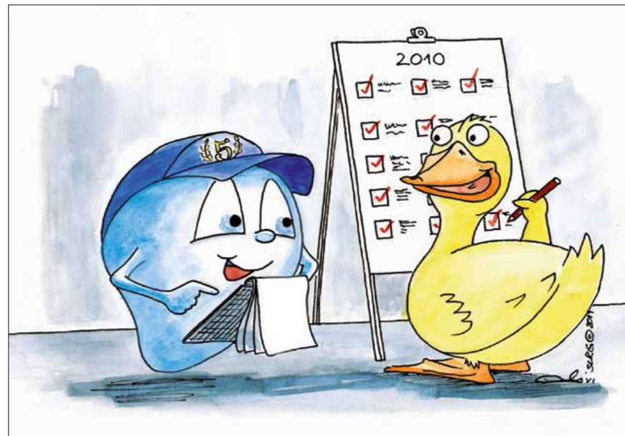
«Pouvons-nous aller à la piscine?»

Le projet «L'eau et moi» a été créé lors de l'assemblée des délégués 2005. Après 12 mois de développement intensif du projet, il a été officiellement lancé en mai 2006. Depuis, les ambassadeurs et ambassadrices d'eau ont déjà visité 2'212 écoles enfantines et 37'558 enfants ont profité de notre programme de prévention. En 2010, ce bel élan a été poursuivi.