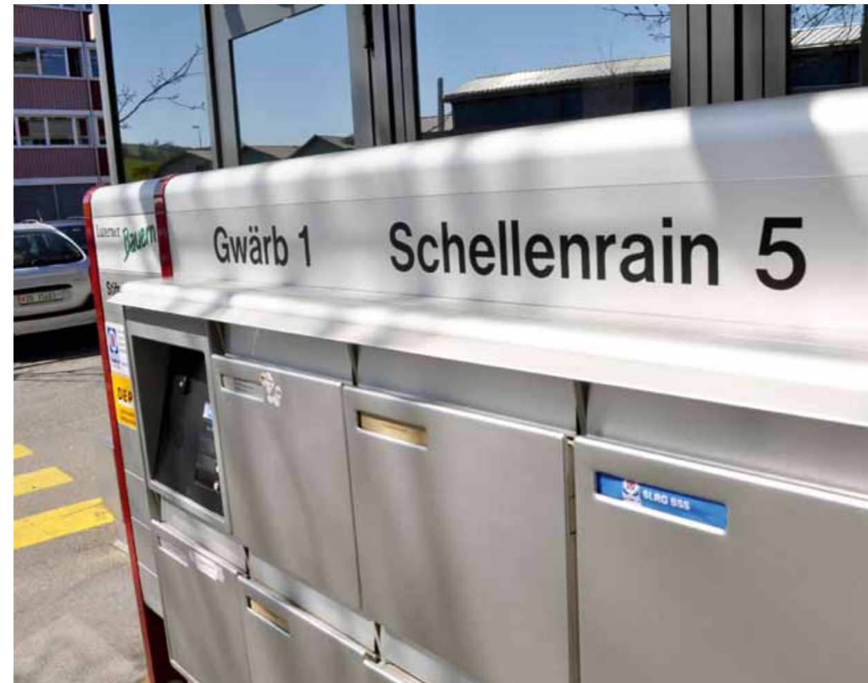
Un des événements les plus marquants de 2010: le déménagement du siège administratif à Sursee.

Il y a des jours, où nos vœux nous paraissent inaccessibles, comme des étoiles au firmament. Malgré tout, ça vaut la peine de les garder en mémoire, comme des panneaux d'indication de direction. En 2010, l'équipe du siège administratif s'est de temps à autre arrêtée pour filtrer les vœux et réaliser ce qui était réalisable.