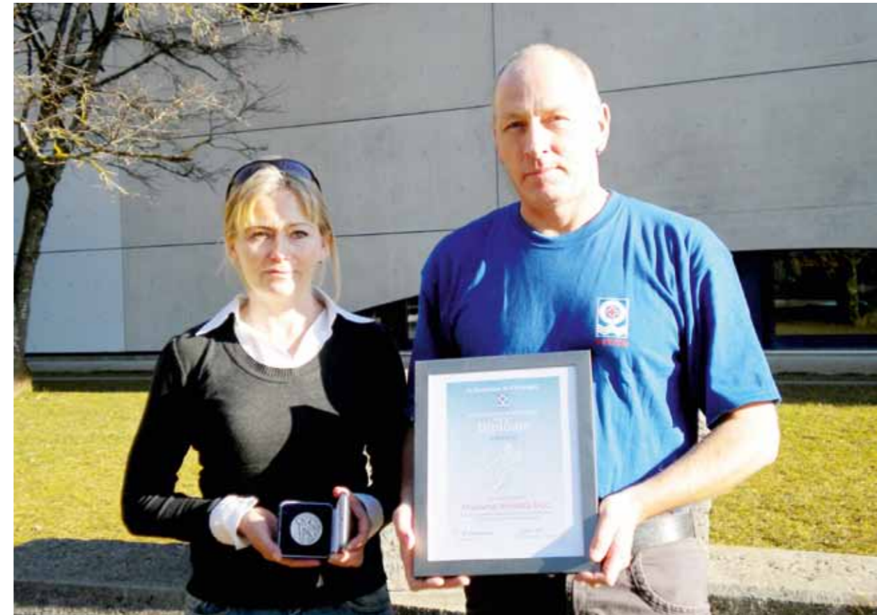
Dans le courant de l'année passée, la Fondation St-Christophe a distingué quelques sauveteurs méritants.