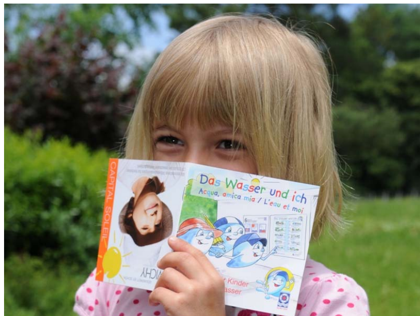
Wassertropfen «Pico» zeigt den sicheren Umgang mit Wasser und Sonne – den Kindern gefällt es.

Obwohl die Gefahren schädlicher UV-Strahlung seit Jahren bekannt sind, verwenden nur elf Prozent der Eltern für ihre Kinder einen Sonnenschutz 1 . Dies, weil sie irrtümlich glauben, dass die Haut ihrer Kinder noch unverwundbar sei. Da Eltern ihr eigenes Sonnenschutzverhalten auf ihre Kinder übertragen, könnte dies für die empfindliche Kinderhaut schlimme Langzeitfolgen haben.